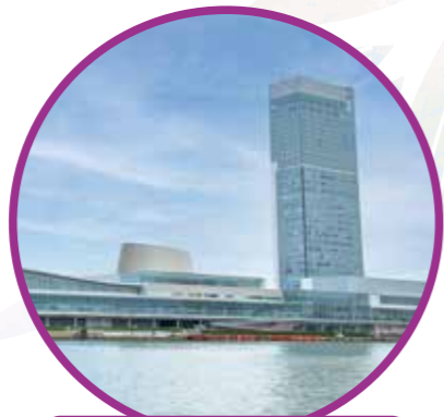
朱鷺メッセ 新潟コンベンションセンター