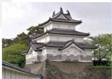
しばたじょう 新発田城