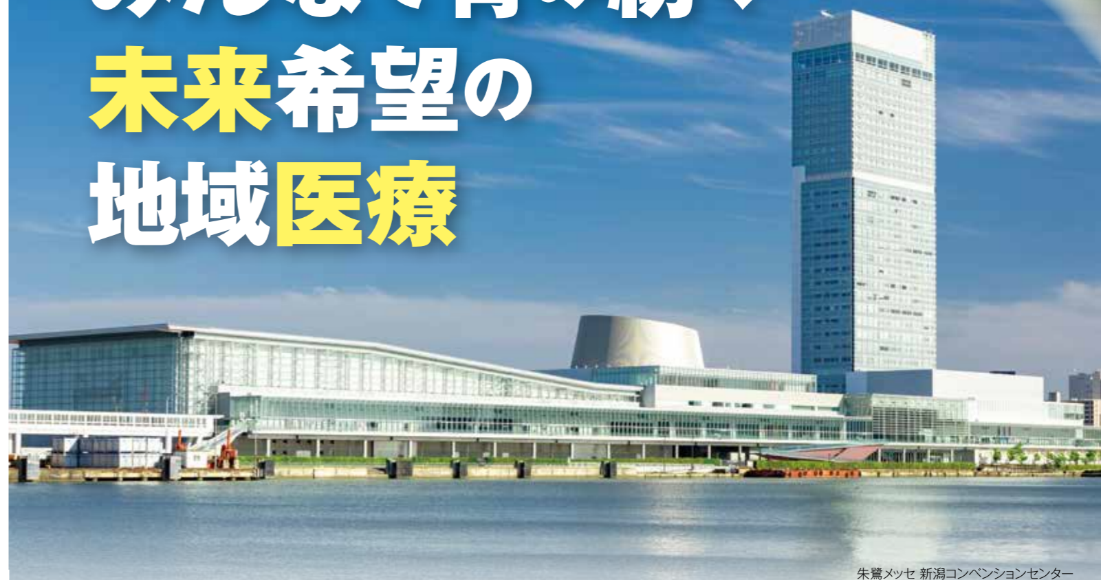
朱鷺メッセ 新潟コンベンションセンター